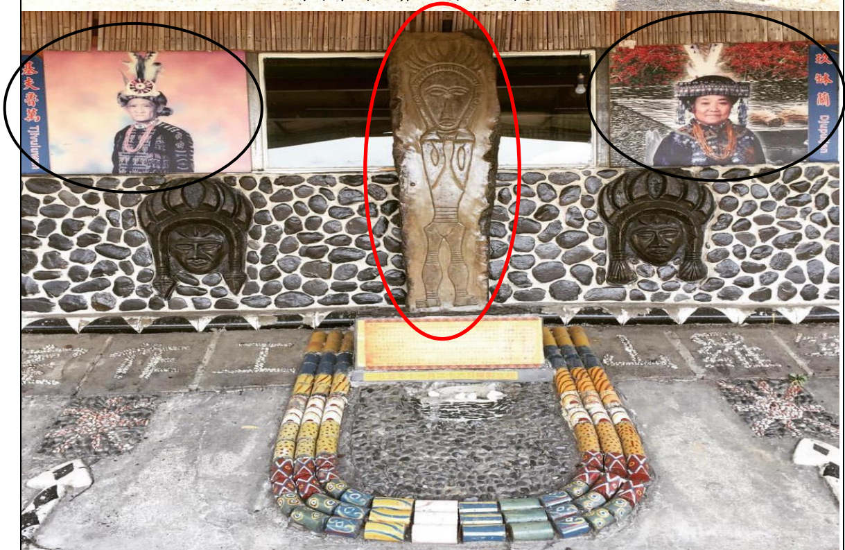
※今複製(於中間亮面淺咖啡色，男像正面/女像背面)立柱完竣之雙面石雕祖先像，相較於臺大人類學所保存之雕像較為亮面，雙面石雕像原件因時間久遠石材風化，男女性徵的差異已難辨識，複製石雕像則修補了此處。左上圖片為男祖先吉福祿萬 (Tjivuluwan)、右上圖片為女祖先玖柏蘭恩(Djupelan)。