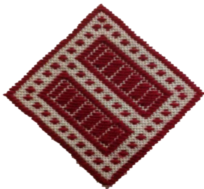
圖 2 中間有線條紋的日字紋