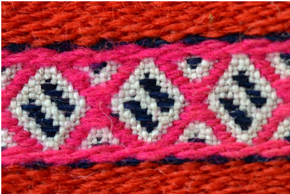
圖 1 日字紋

hinoroSa'an (日字紋) 通常不會單獨出現，通常是數個 hinoroSa'an (日字紋) 堆疊排列。現今服飾多以現代布材取代，也不只出現在 binbinlongan 上。